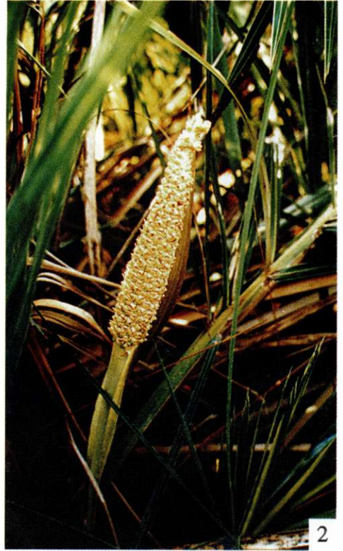
Foto 1: Acrocomia aculeata en las pampas de Santa Cruz. Foto 2: Pequeña palma acaule, Allagoptera leucocalyx