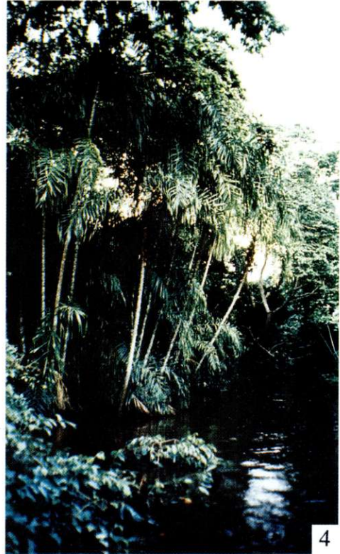
Foto 3: Una chonta ( Astrocaryum jauari ) multicaule en el río Itenez Foto 4: El marayau de río Bactris riparia en los bosques de galería