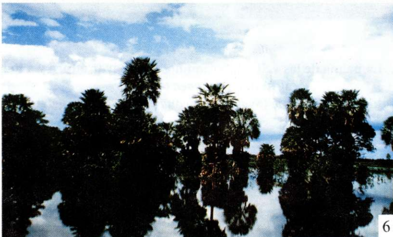
Foto 5: La hoja redonda ( Chelyocarpus chuco ) en los bosques amazónicos. Foto 6: Copernicia alba en las pampas estacionalmente inundadas del Beni. Foto 7: Mauritia flexuosa adaptada a aguas negras en el subandino.