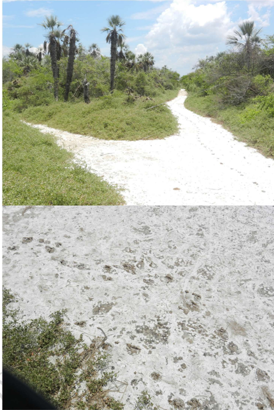
Figura 2. Formaciones de Trithrinax schizophylla en el Área Protegida Palmera de Saó (APPS).

a. Palmares de saó y b. asociación con suelos salinos.